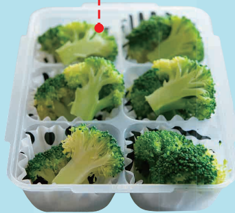
冷凍ゆで野菜・ブロッコリー