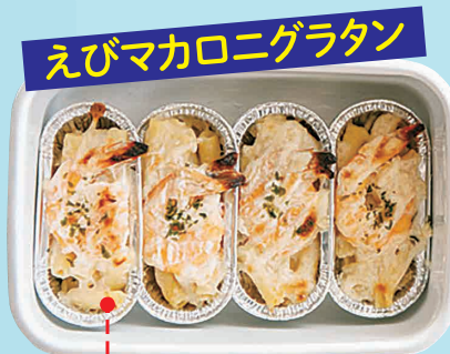
えびマカロニグラタン